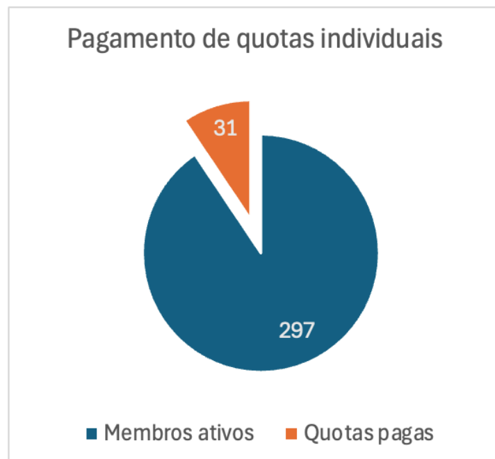
Fig. 3 – Pagamento de quotas individuais