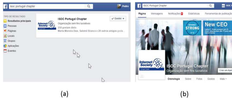
Figura 1 – Presença do ISOC Portugal no Facebook

A comunicação de informação numa base muito frequente tem sido feita através do Facebook: